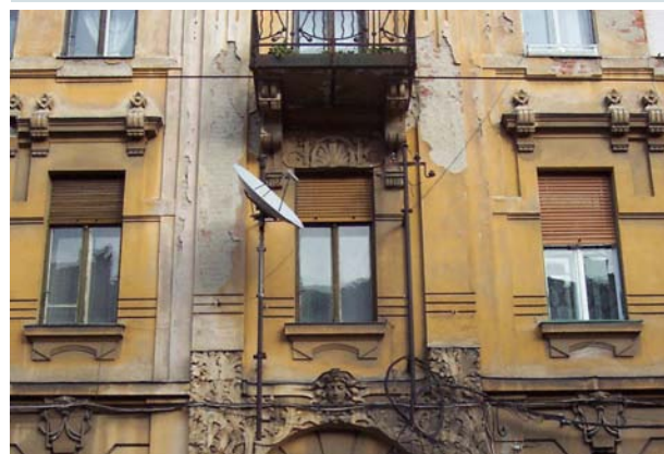
GREȘITI! Se interzice montarea antenelor și a cablurilor vizibil pe fațadele istorice, pentru că alterează grav aspectul clădirilor.