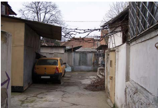
GREȘIT! Curte interioară năpădită de construcții parazitare.