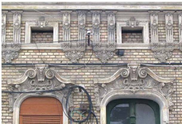
GREȘITI! Cablurile și conductele, montate absolut haotic pe fațadele istorice, produc un efect extrem de neplăcut.