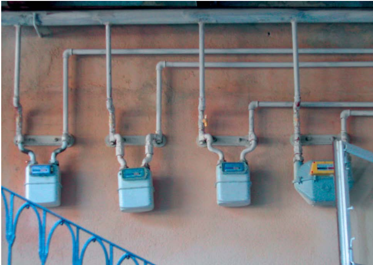
CORECT! Instalațiile tehnice, contoarele și conductele trebuie grupate într-un singur loc, cât mai discret.