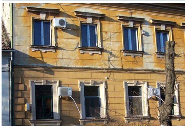
GREȘITI! Instalațiile de climatizare, montate pe fațadele dinspre stradă, alterează aspectul ansamblurilor istorice.