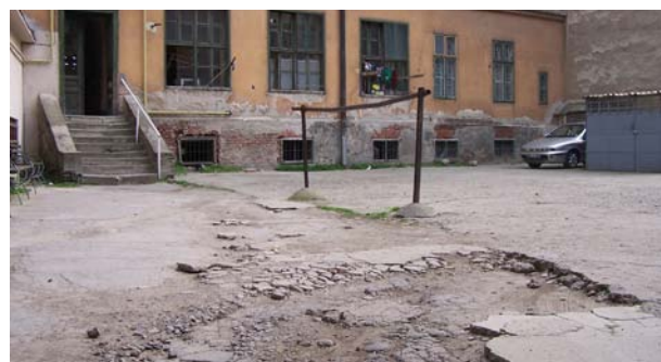
GREȘIT! Curte interioară cu pavaj deteriorat.