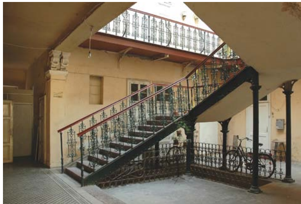
CORECT! Scări și cursive cu deosebită valoare plastică în curtea interioară.