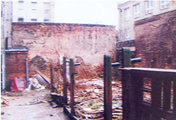
CORECT! Construcțiile anexe parazitare, datând din perioade recente, au fost îndepărtate. Curtea interioară capătă mai multă lumină.