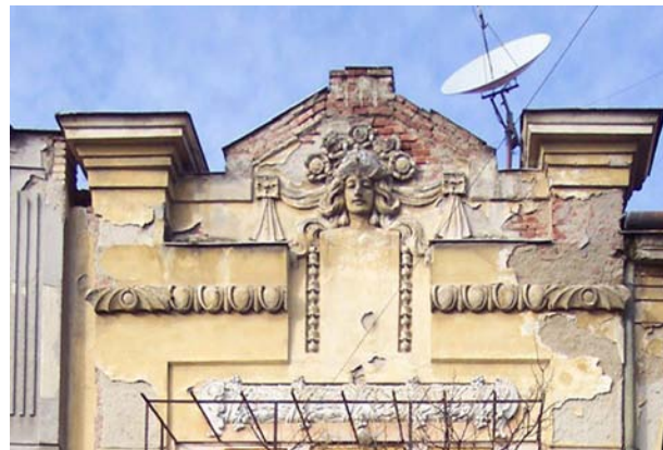
GREȘITI! Antenele parabolice trebuie montate astfel, încât să nu fie vizibile dinspre stradă.