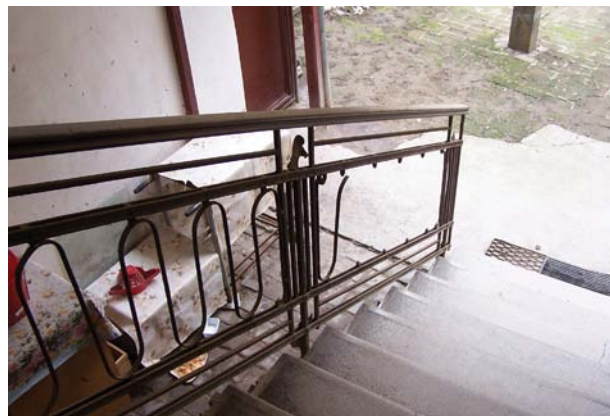
GREȘIT! Balustrada din metal este deteriorată parțial. Există pericolul producerii de accidente.