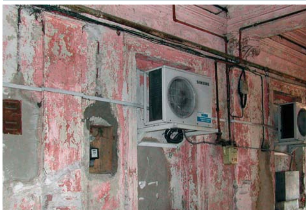
GREȘIT! Instalațiile tehnice sunt amplasate arbitrar și influențează negativ aspectul curții interioare.