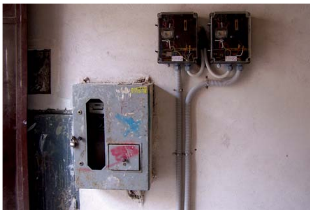
CORECT! Instalațiile tehnice sunt grupate corect, în gangul de intrare, și nu alterează aspectul plastic al fațadei.