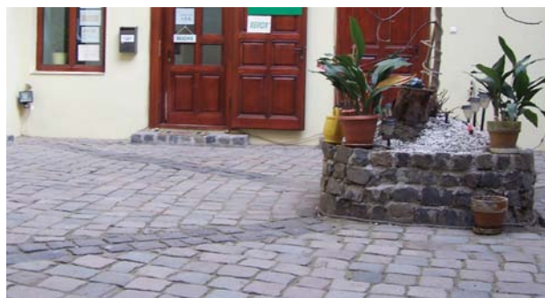
CORECT! Un pavaj reușit, care permite și o irigare corectă a zonei verzi din curtea interioară

Pavajele noi, din materiale naturale, trebuie realizate cu pante ușoare spre mijlocul curții, pentru a asigura dirijarea apelor meteorice, îndepărtându-le de pereții exteriori ai clădirilor, reducând astfel riscul apariției igrasiei.