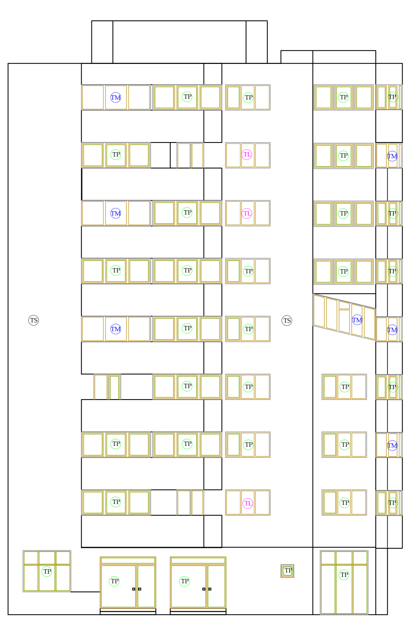
Fatada lateral stanga Scara 1:100