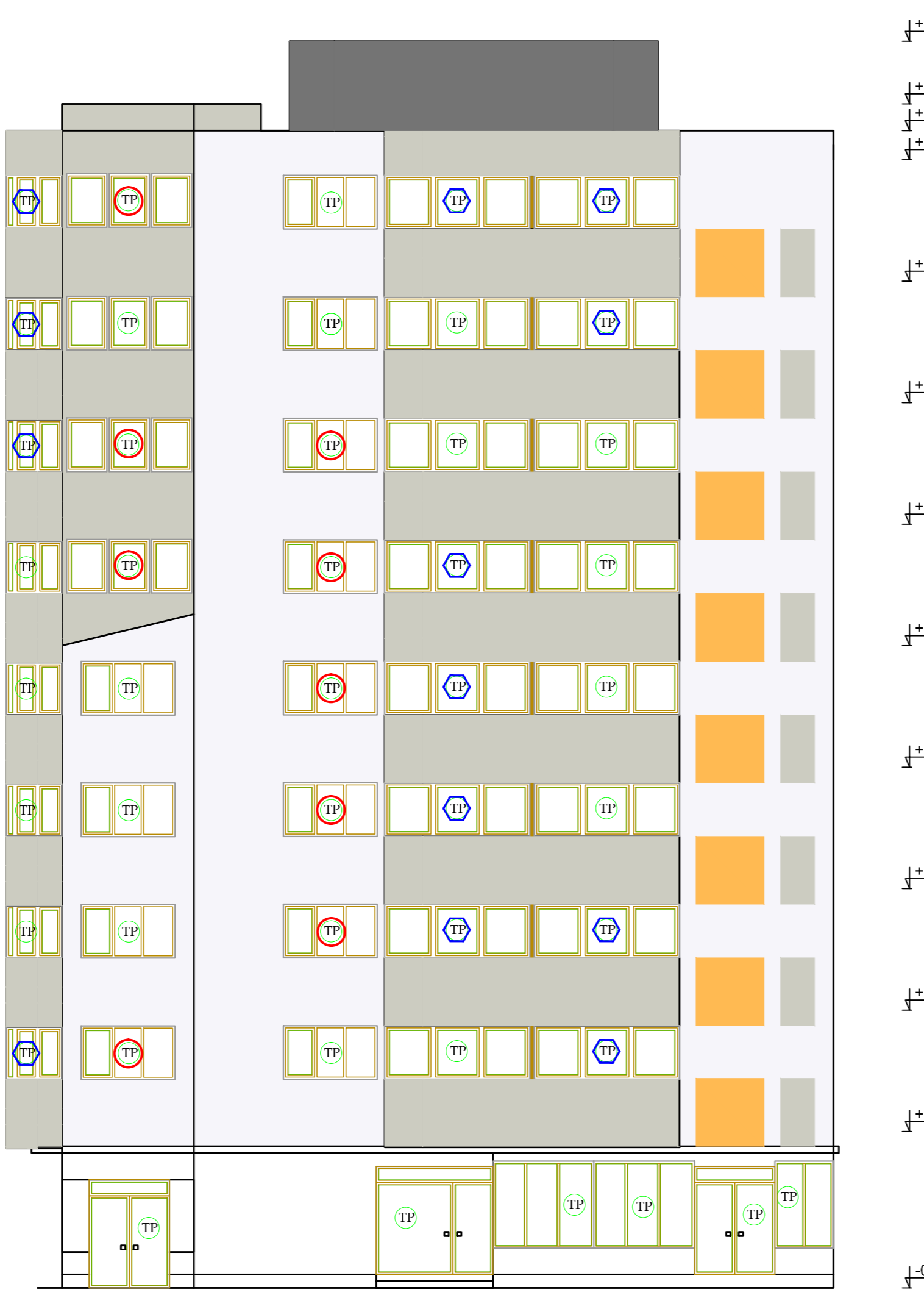
Fatada lateral dreapta Scara 1:100