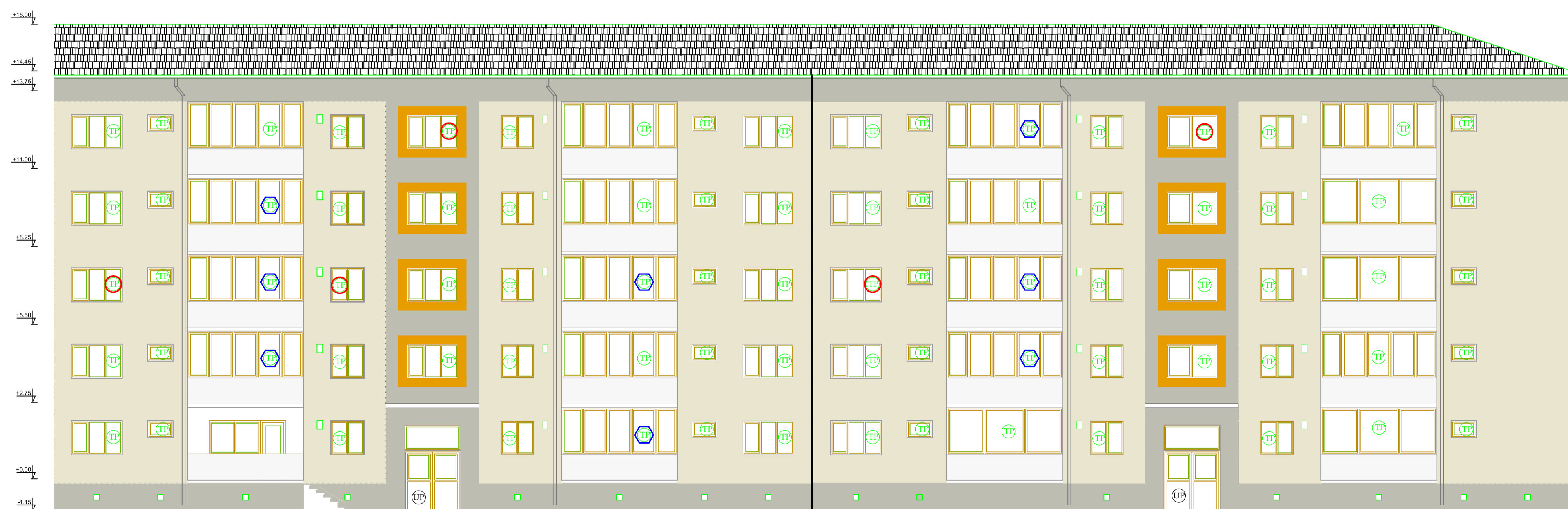
FATADA PRINCIPALA PROPUS