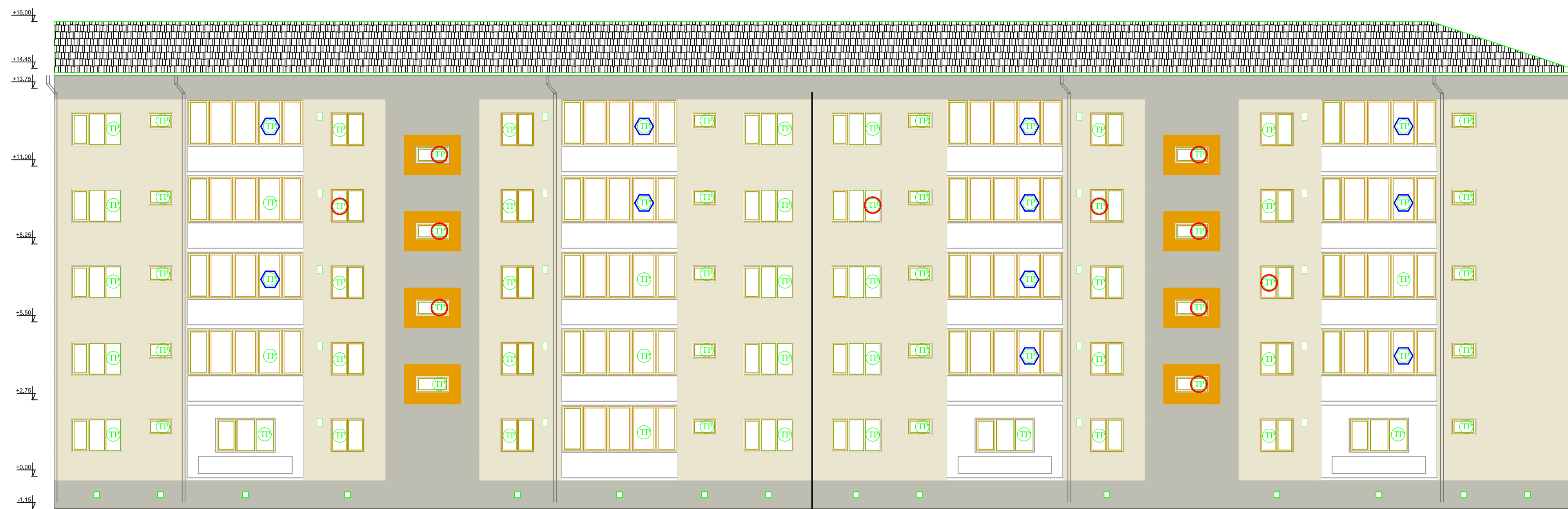
FATADA SPATE PROPUS