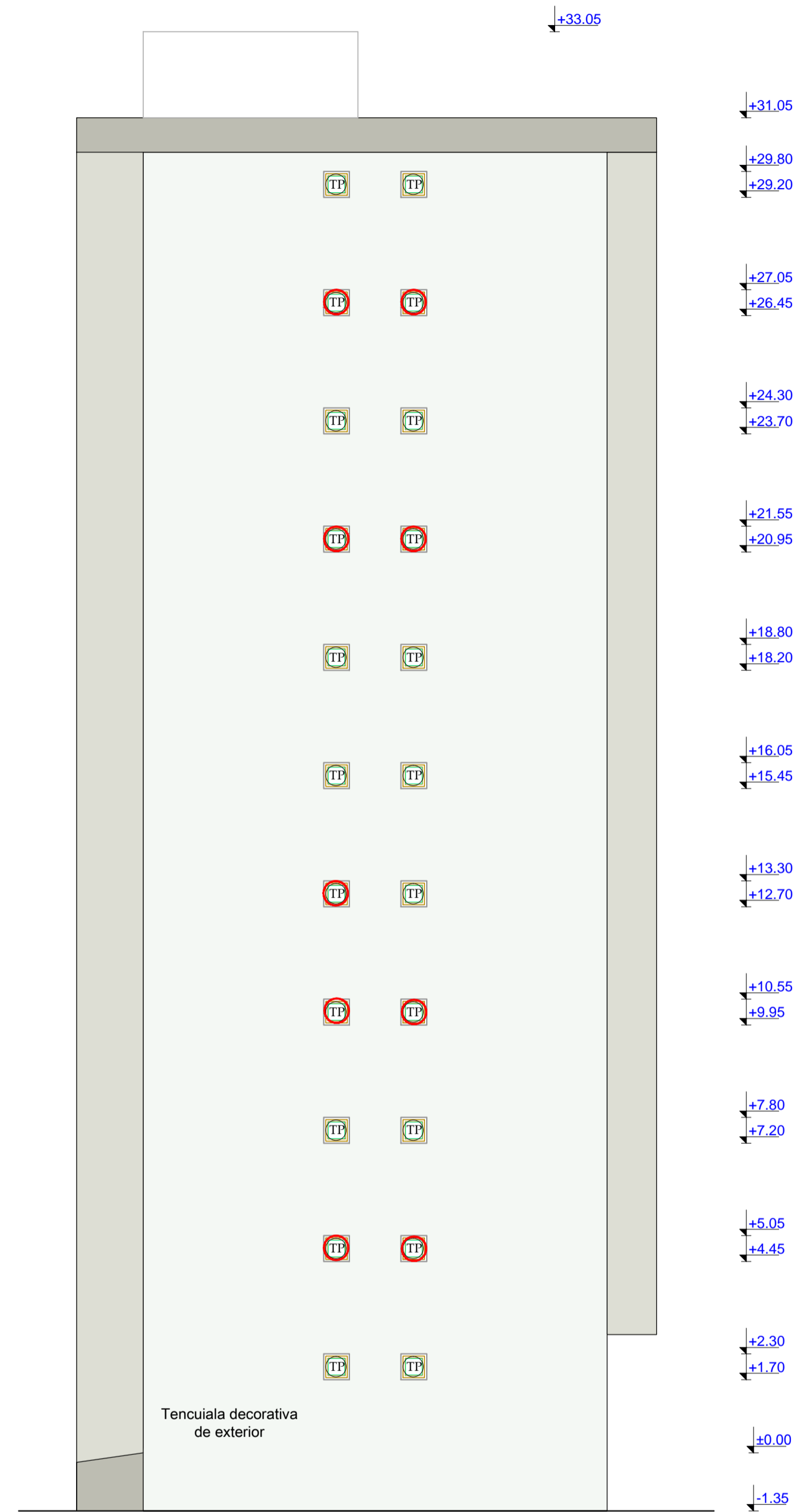
Fatada Laterală Dreapta