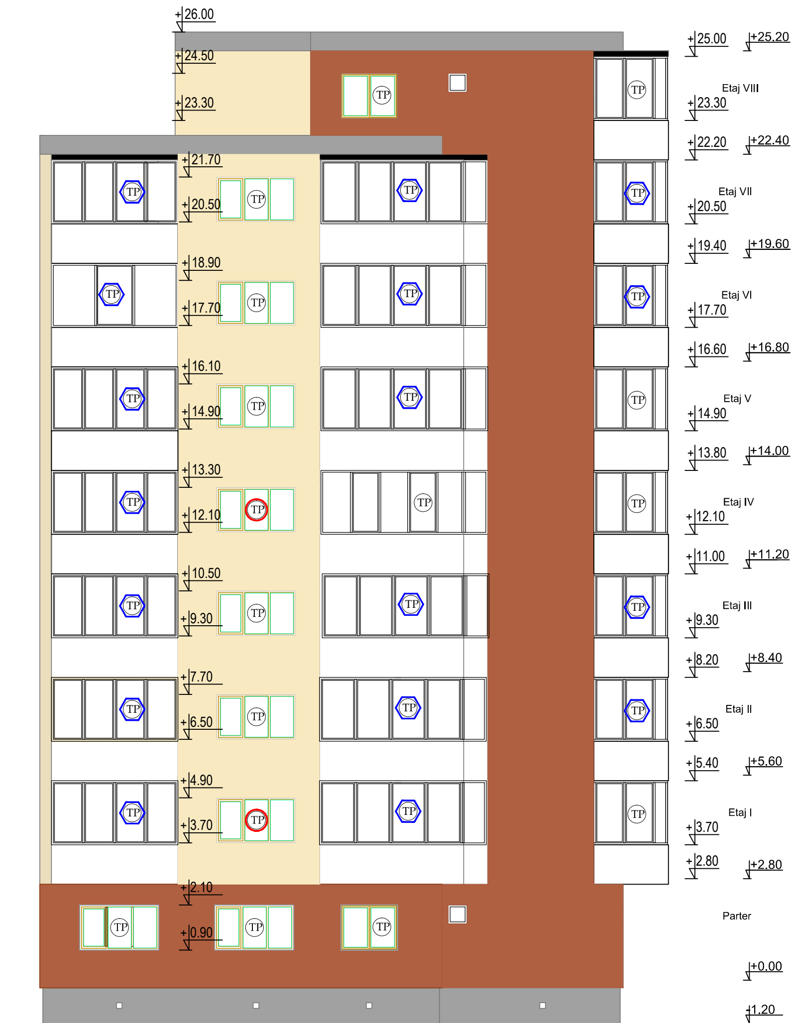
Fatada laterala dreapta propusa Scara 1:100