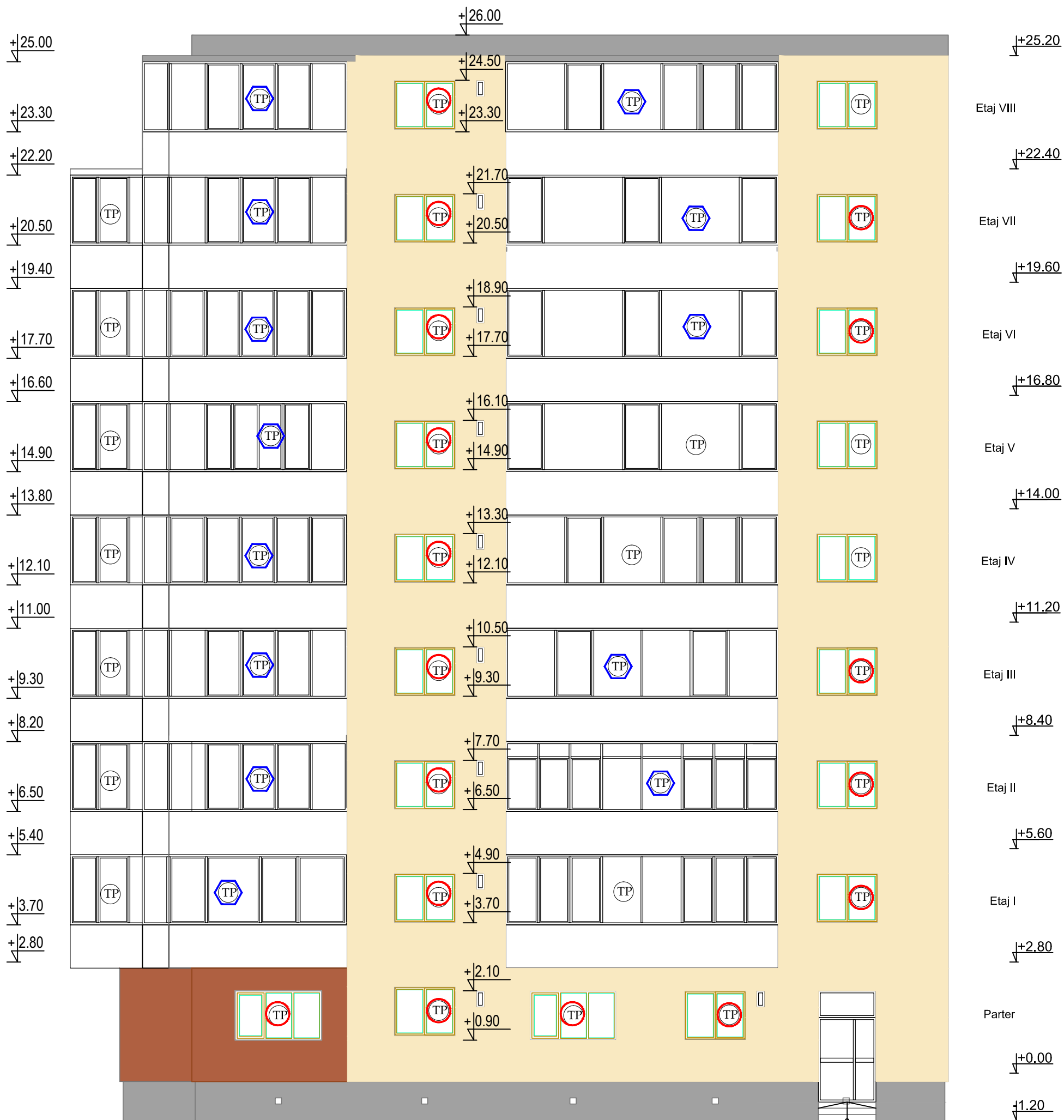
Fatada posterioara propusa Scara 1:100