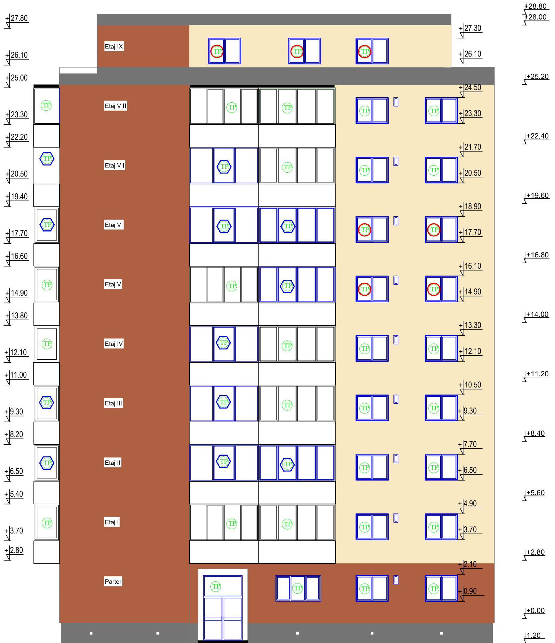
Fatada principala propusa Scara 1:100