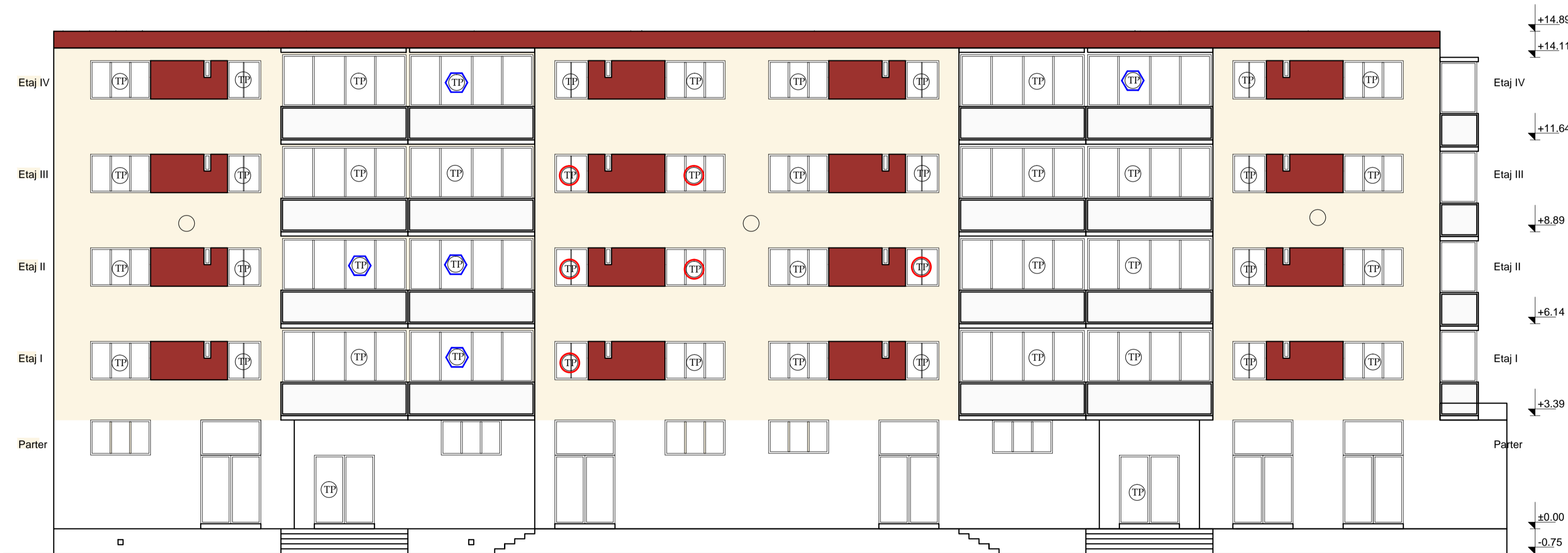
Fatada posterioara propus Scara 1:100