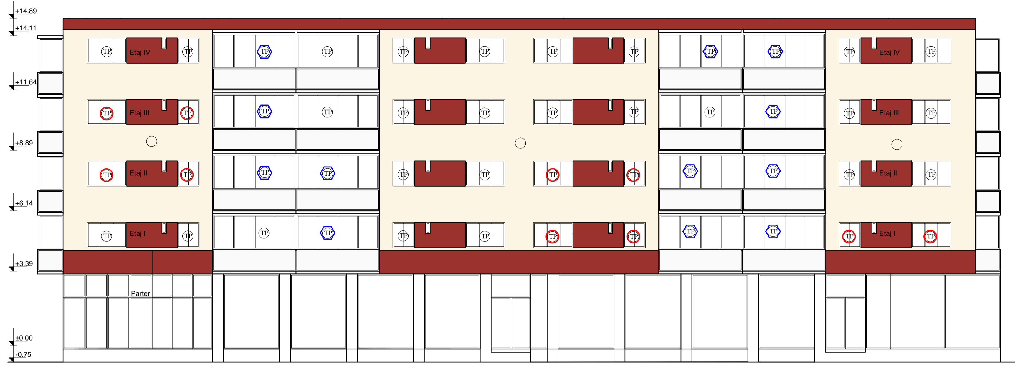
Fatada principala propus Scara 1:100