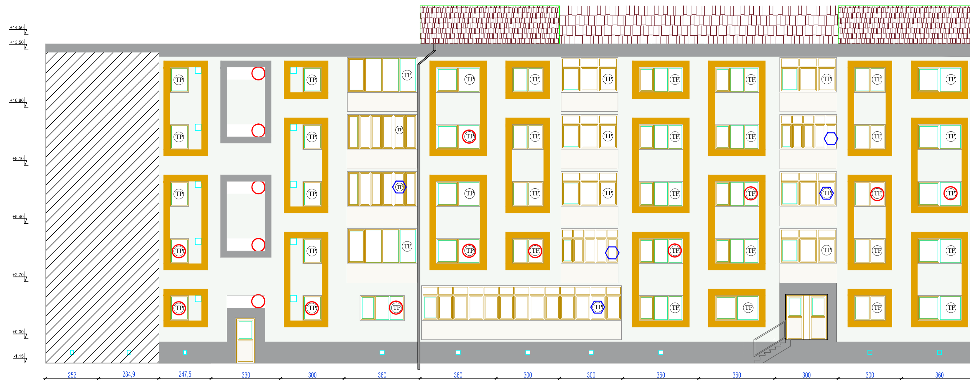
BL 12, NR.70 Fatada spate propusa