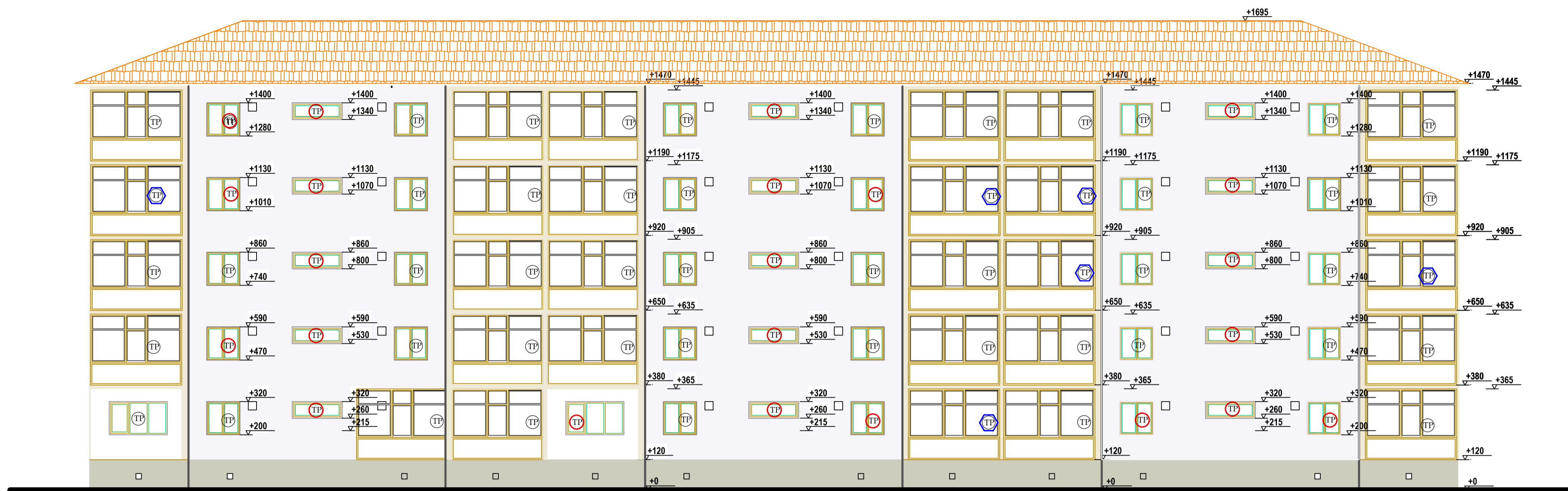
FATADA POSTERIOARA PROPUSA