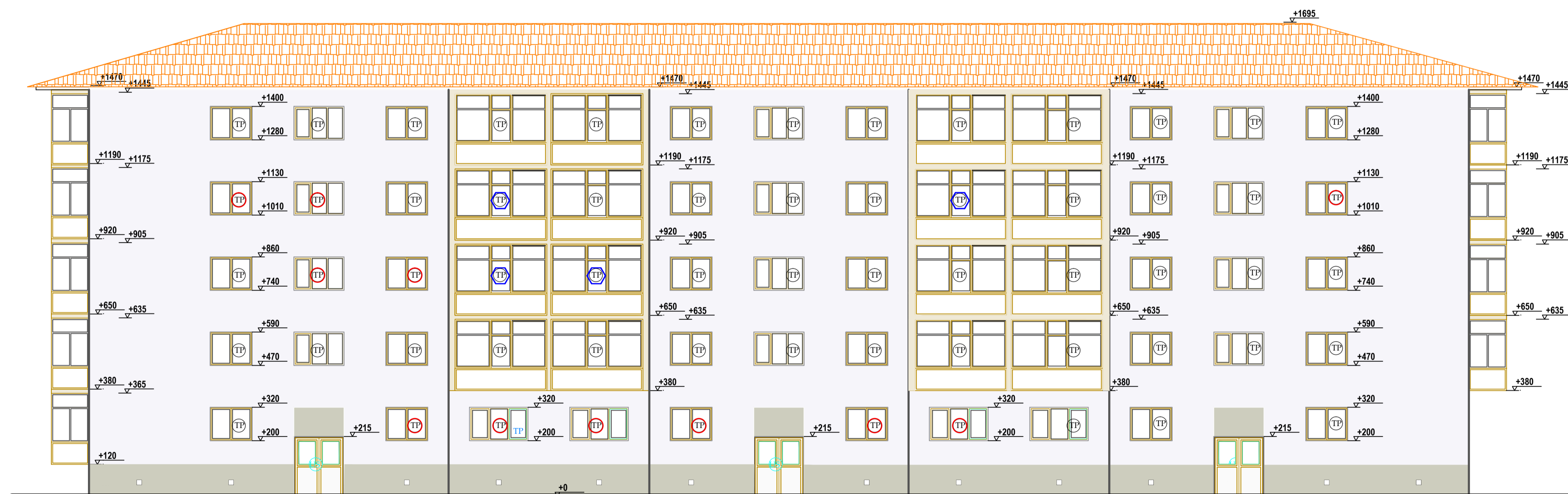
FATADA PRINCIPALA PROPUSA