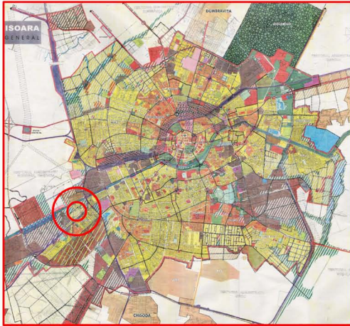
PLAN DE INCADRARE IN PUG