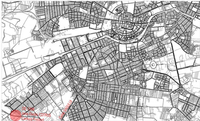
AMPLASARE TEREN IN ORAS

CONSTRUIRE HALĂ DE DEPOZITARE ȘI BIROURI ÎN REGIM DE ÎNĂLȚIME P+1E = ÎNCADRARE ÎN ZONĂ =