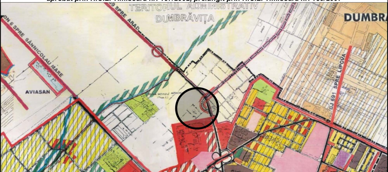
Plan de incadrare - Primaria Mun. Timisoara ( Scara 1: 5000 )

aprobat prin H.C.L. Timisoara nr. 157/2002, prelungit prin H.C.L. Timisoara nr. 139/2007