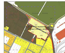
INCADRARE IN ZONA, sc. 1:10.000