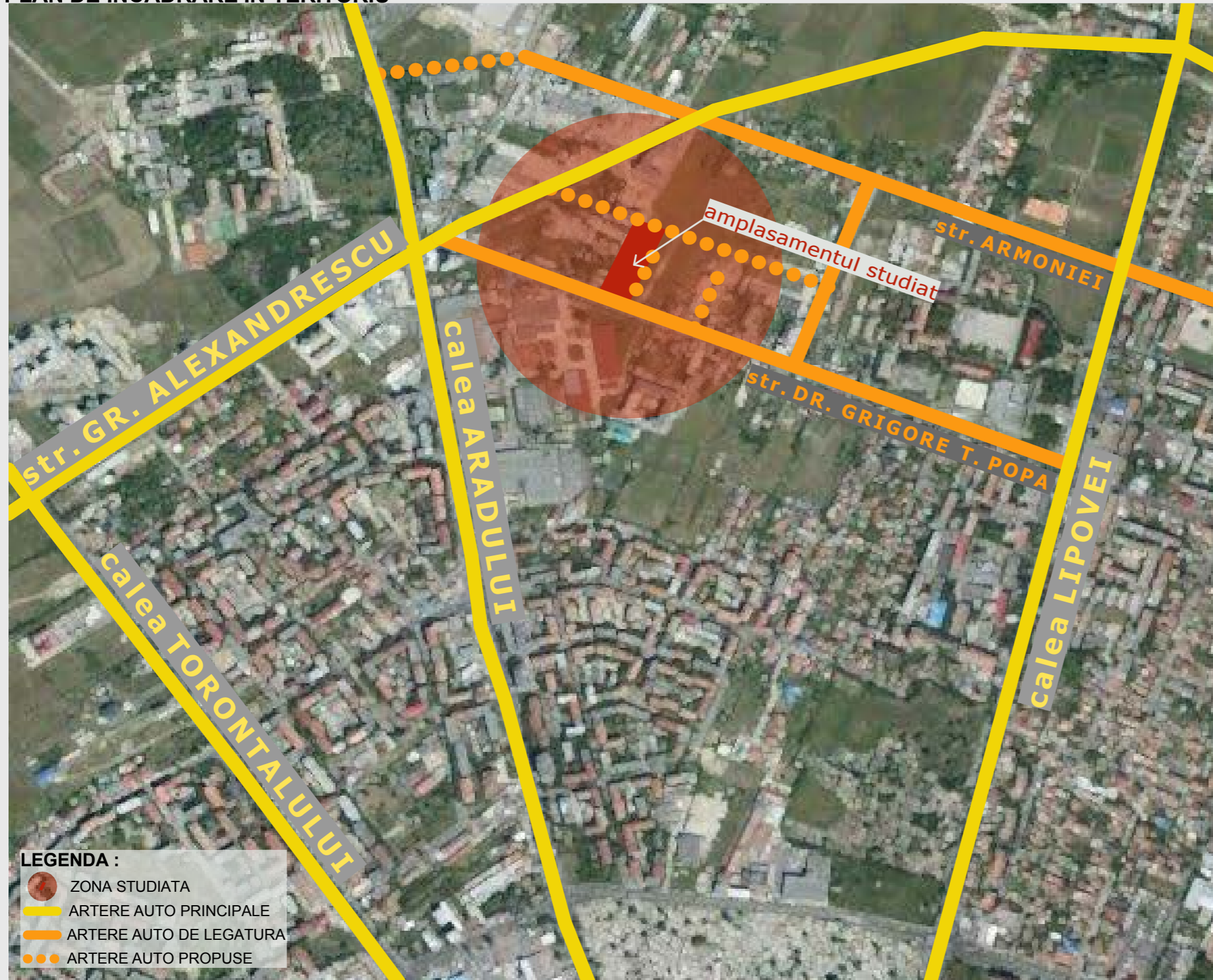
PLAN DE INCADRARE IN TERITORIU