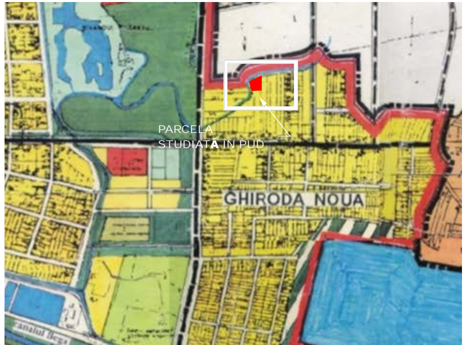
ÎNCADRARE ÎN PUG ÎN CURS DE APROBARE