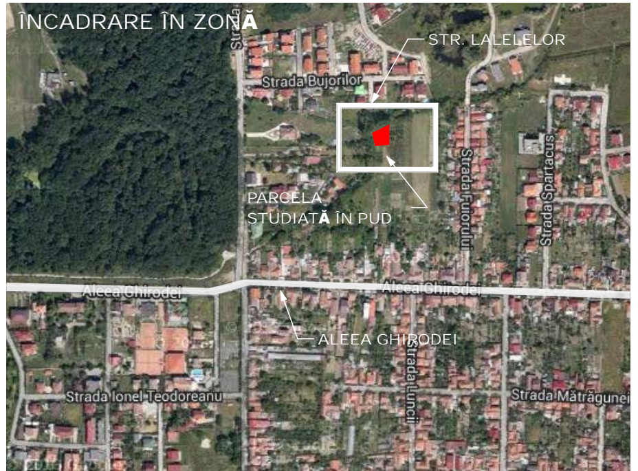
ÎNCADRARE ÎN PUG AFLAT ÎN VIGOARE