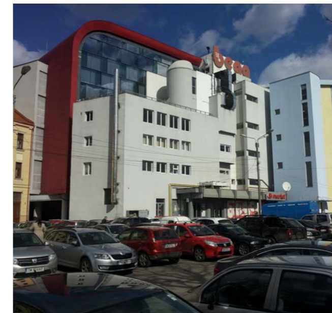
Fatada spre Parcul Civic