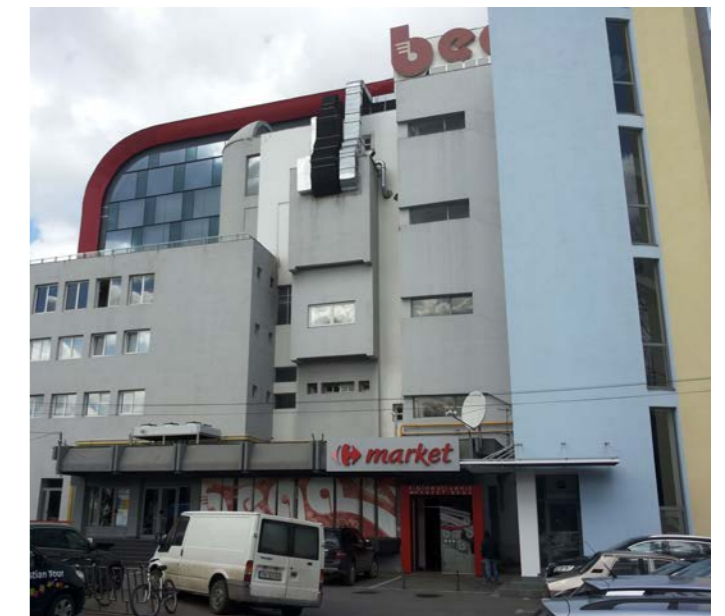
Fatada spre Parcul Civic