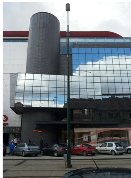
Fatada strada Proclamatia de la Timisoara