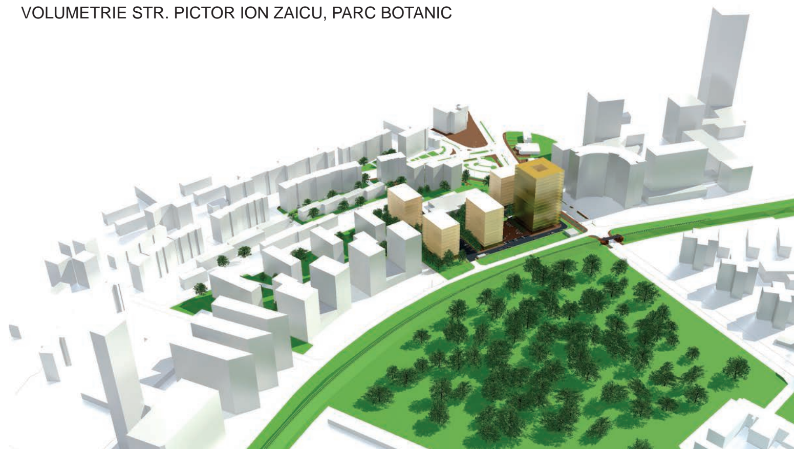
VOLUMETRIE STR. PICTOR ION ZAICU, PARC BOTANIC