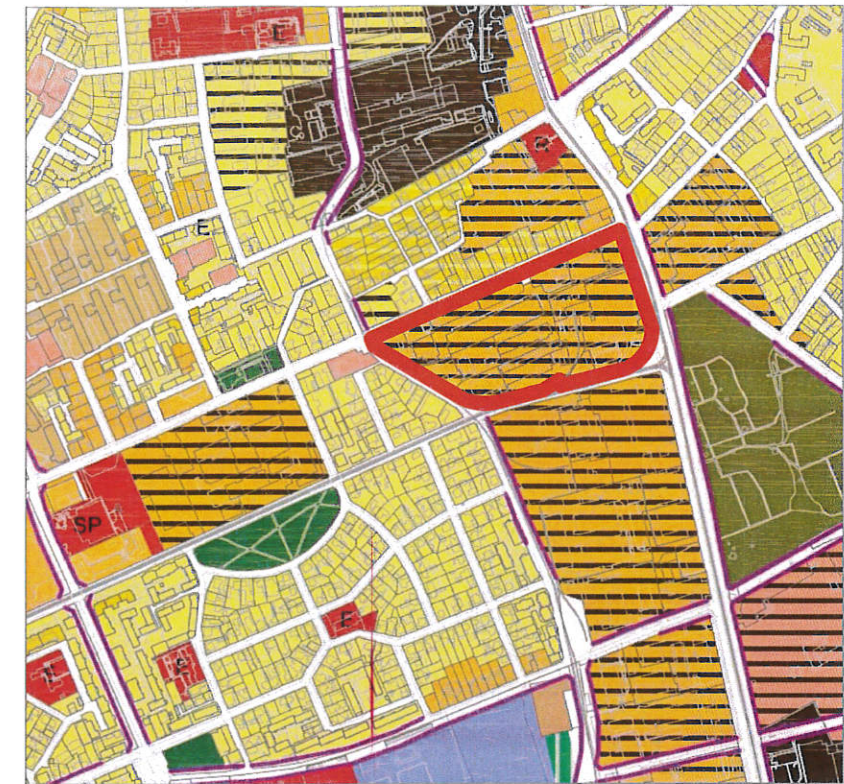
INCADRARE CONF. PLAN URBANISTIC GENERAL (P.U.G. 2012)