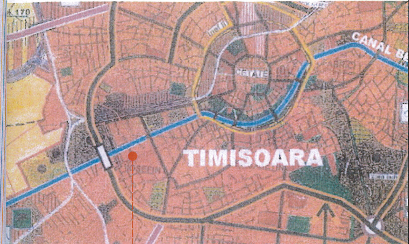
str. VULTURILOR nr. 64, TIMISOARA