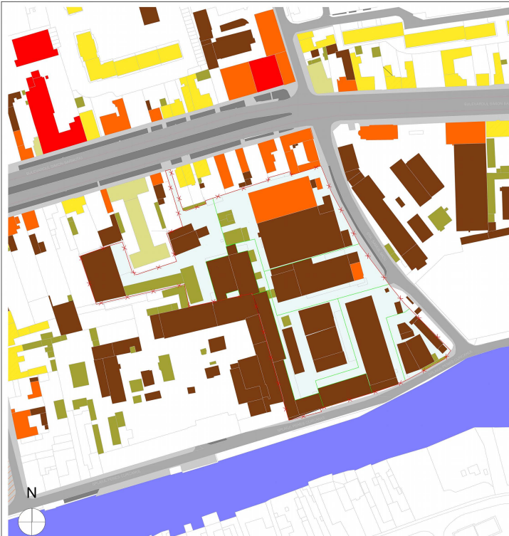
SITUAȚIA EXISTENTĂ - scara 1:1000