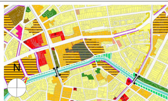
Analiză funcțiuni - Zonificarea teritoriului intravilan - extras din P.U.G. în lucru 2012