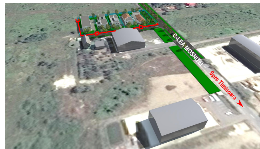
VEDERE AERIANA CU SITUATIA PROPUSA DINSPRE CALEA MOSNITEI