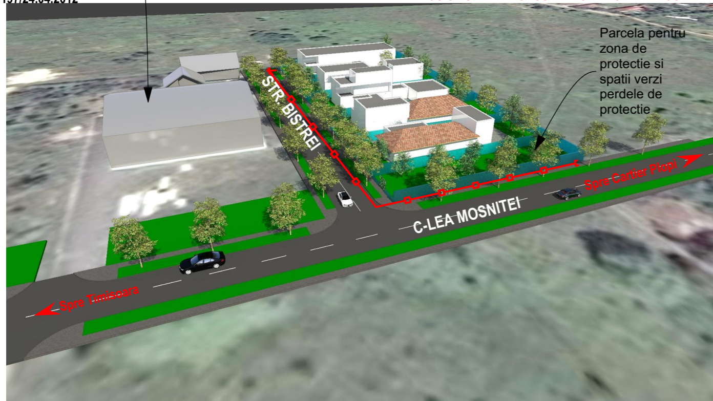
VEDERE AERIANA CU SITUATIA PROPUSA DINSPRE CALEA MOSNITEI

Zona pentru constructii industriale- aprobata prin: HCLM TIMISOARA 190/21.12.2004 SI HCLM TIMISOARA 197/24.04.2012