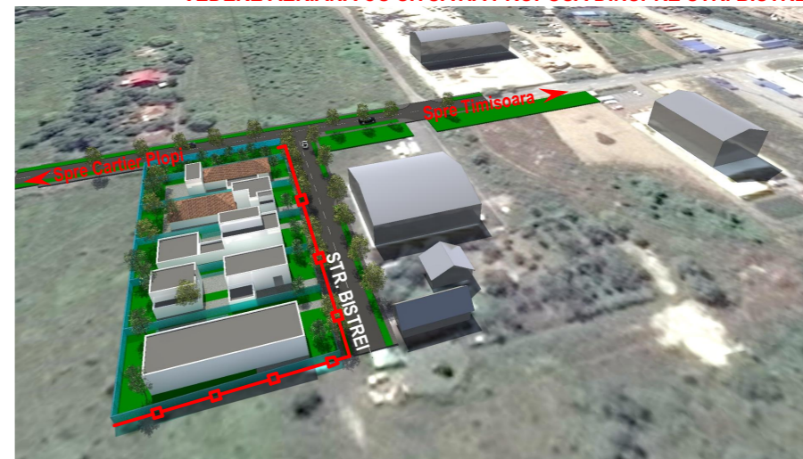
VEDERE AERIANA CU SITUATIA PROPUSA DINSPRE STR. BISTREI