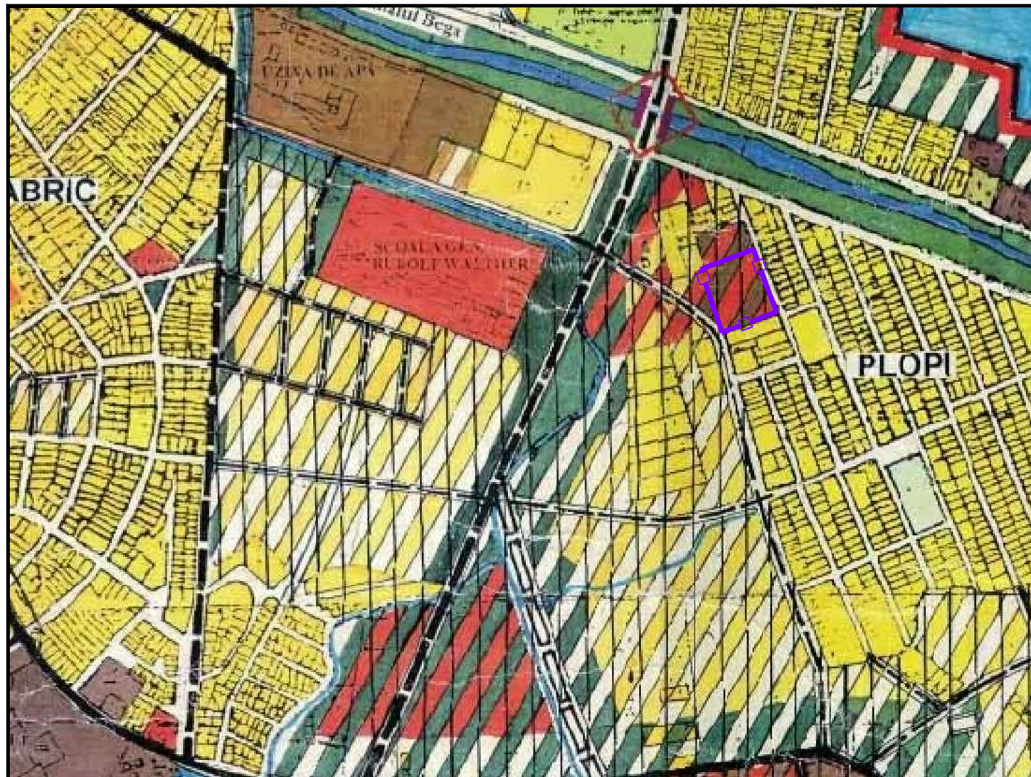
INCADRARE IN P.U.G.