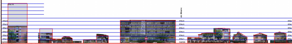
Desfasurata Bd. Eroilor de la Tisa - existent