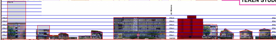
Desfasurata Bd. Eroilor de la Tisa - propus