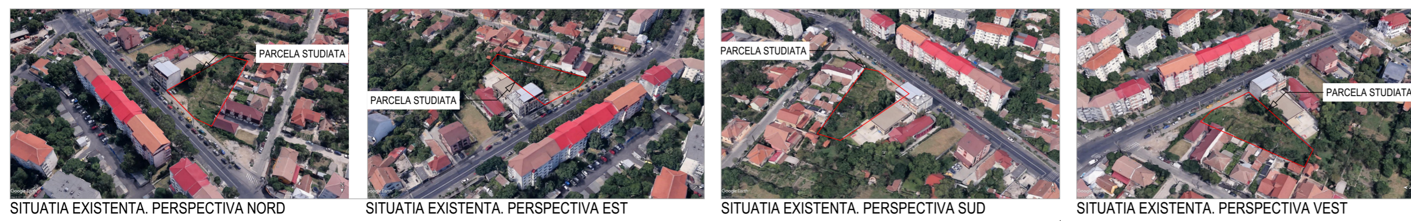
SITUATIA EXISTENTA. PERSPECTIVA NORD