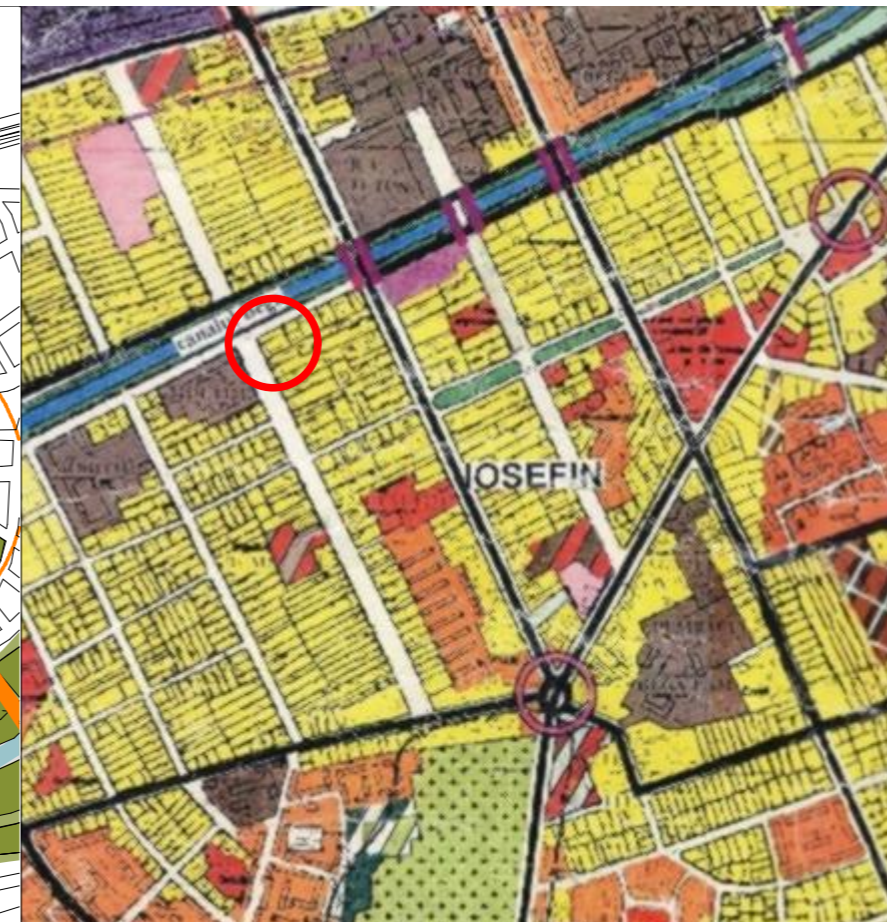
PLAN DE INCADRARE- EXTRAS P.U.G.