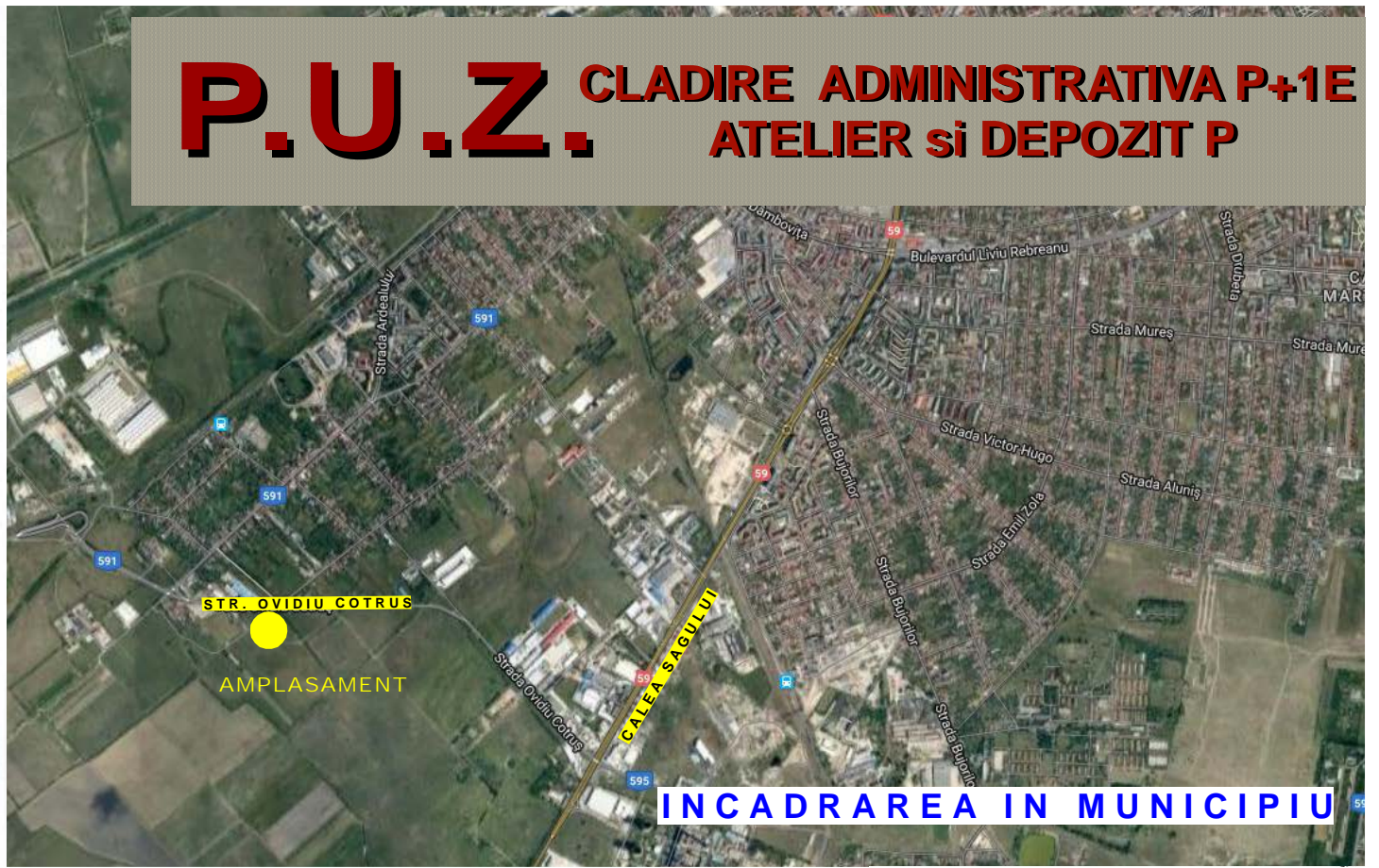
INCADRAREA IN MUNICIPIU