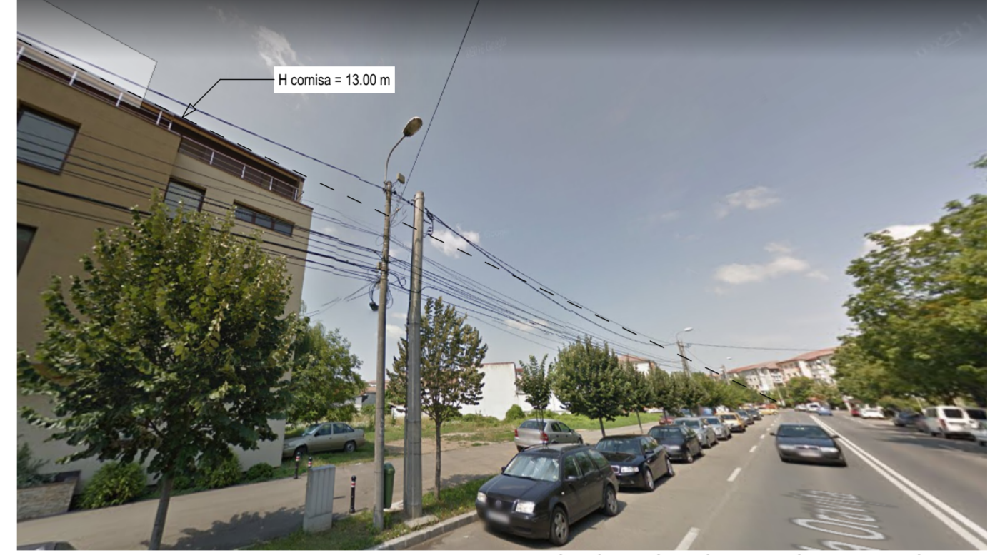
PERSPECTIVA STR. ORAVITA. SITUATIE EXISTENTA

CONFORM CERTIFICAT DE URBANISM NR. 4099 / 21.09.2017 IN SCOPUL: CONSTRUIRE IMOBIL LOCUINTE COLECTIVE P+4 CU SPATII COMERCIALE LA PARTER