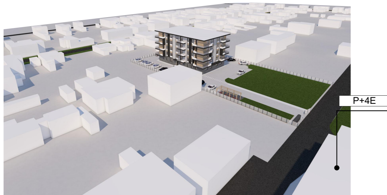
PERSPECTIVA NORD - VEST

mun. Timisoara, jud. Timis, str. Lamaitei, nr. 32-34, CF 443626