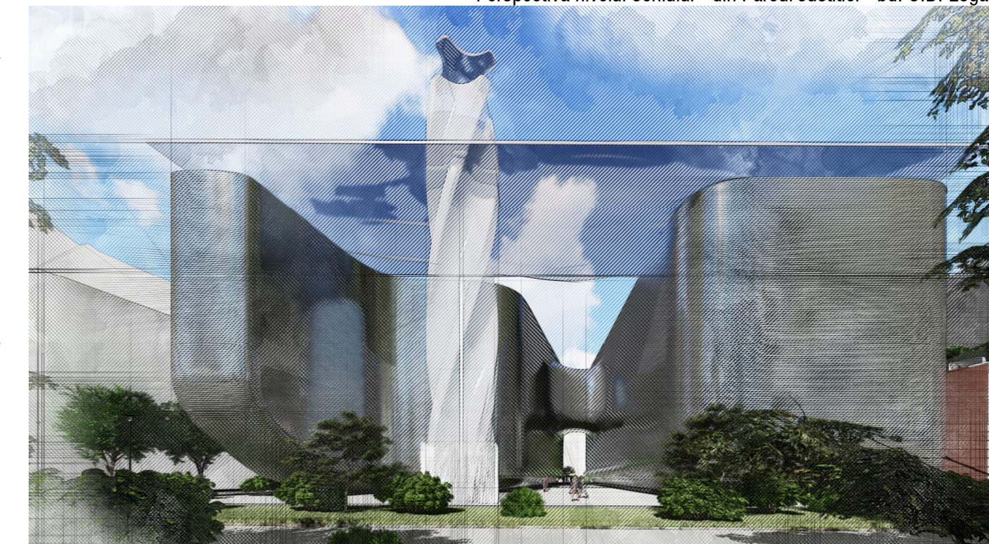
Perspectiva nivelul ochiului - din Parcul Justiției - bd. C.D. Loga

Din punctul de vedere al accesibilității pe sit, Inelul I de circulație rutieră reprezintă cea mai importantă cale de acces. Deși, momentan, sensul acestuia este dublu pe segmentul dintre bulevardele C.D. Loga și M. Eminescu, odată pusă în practică intenția studiului de fezabilitate prezentat anterior, segmentul va putea fi parcurs doar pe direcția sud-nord. Vor apărea: o bandă dedicată transportului în comun și o pistă dublă pentru cicliști. Din punct de vedere funcțional, ansamblul propus va cuprinde locuințe colective, spații pentru cultura, birouri și servicii, funcțiuni comerciale și un hotel.