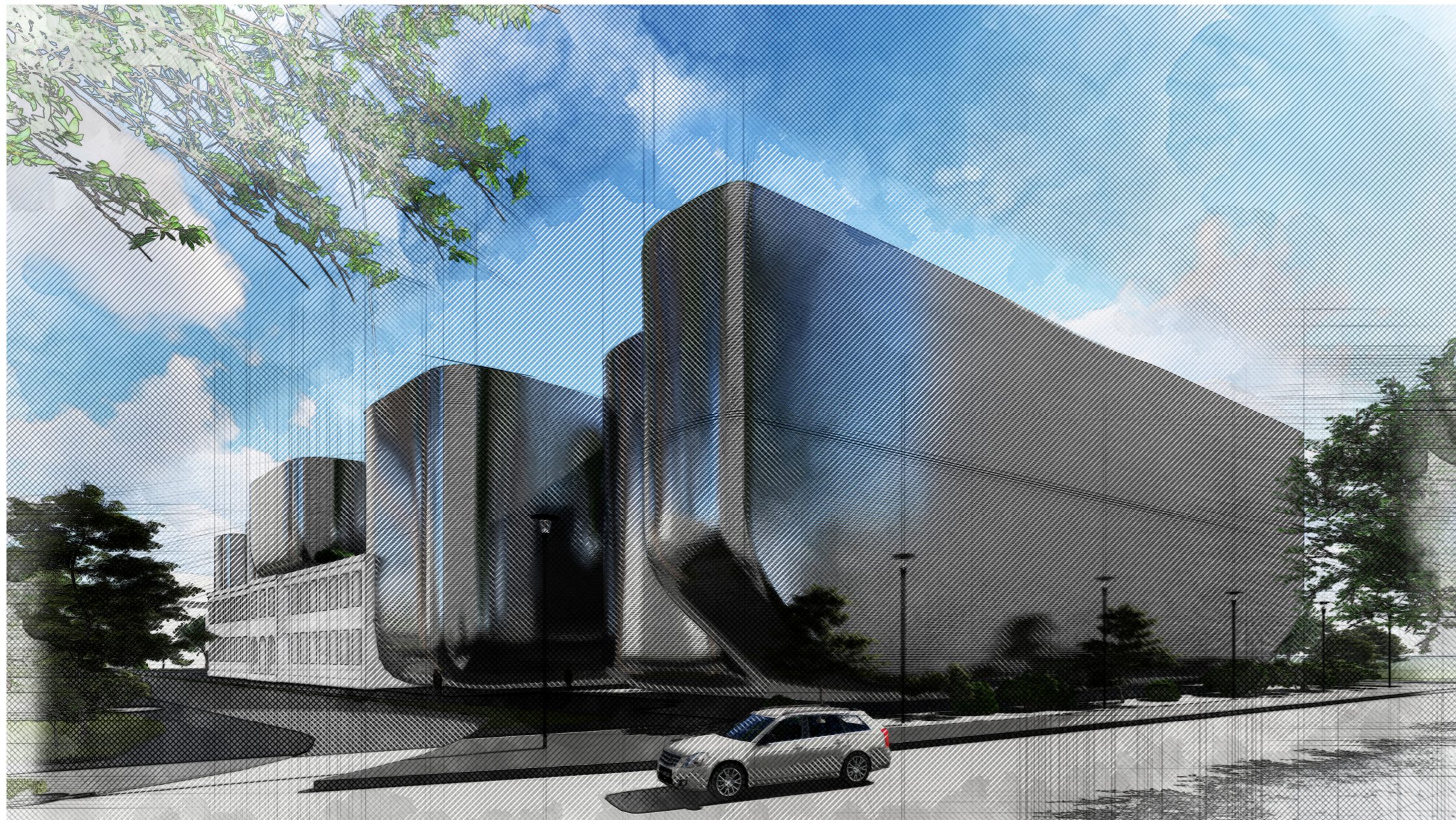
Perspectiva nivelul ochiului - int. M. EMINESCU - 20 DEC. 1989