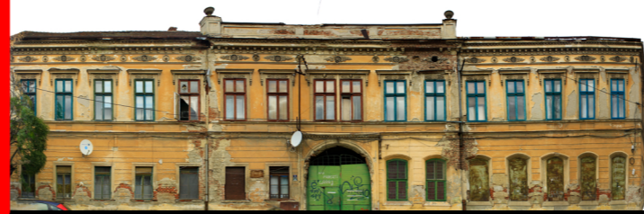
piata Aurel Vlaicu