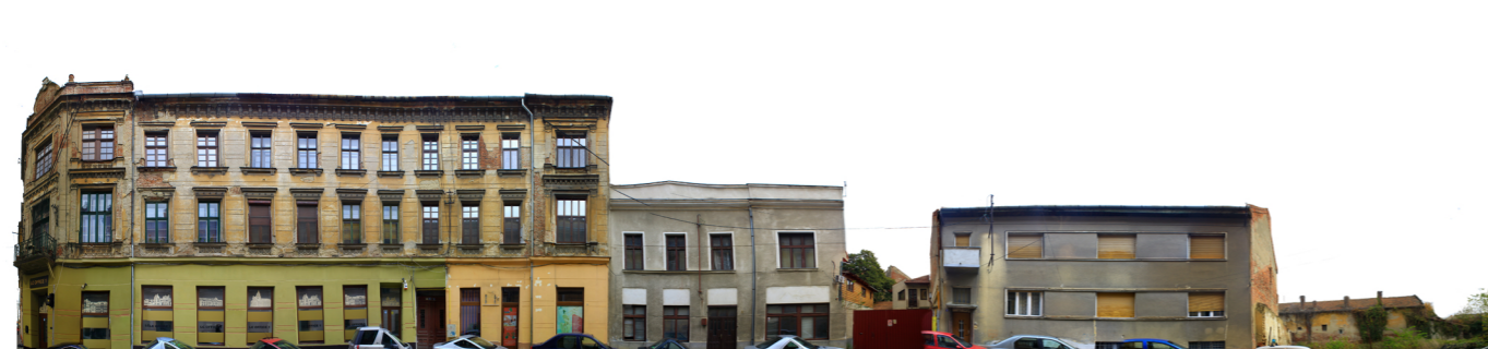
strada Anton Pann