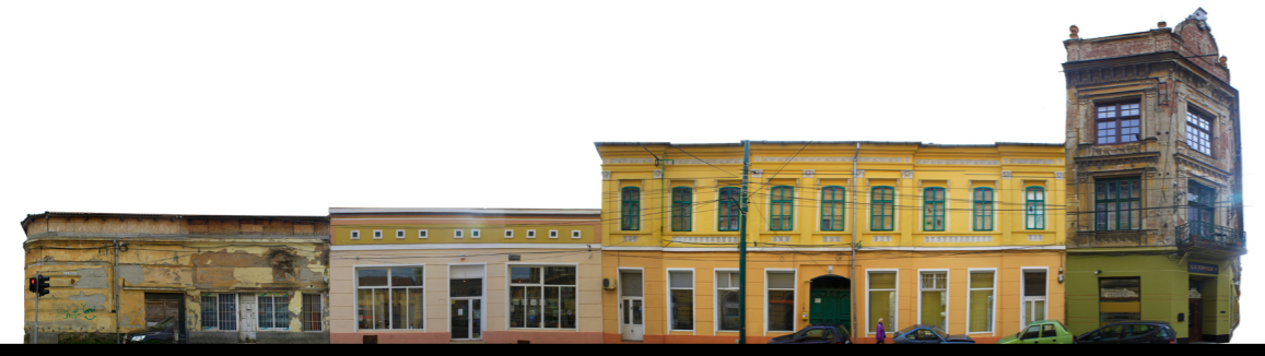
strada Ion Mihalache