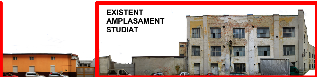
strada Anton Pann