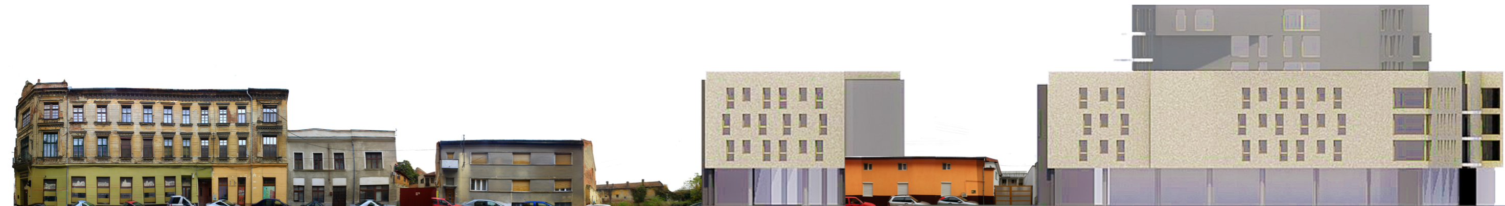
s t r a d a A n t o n P a n n