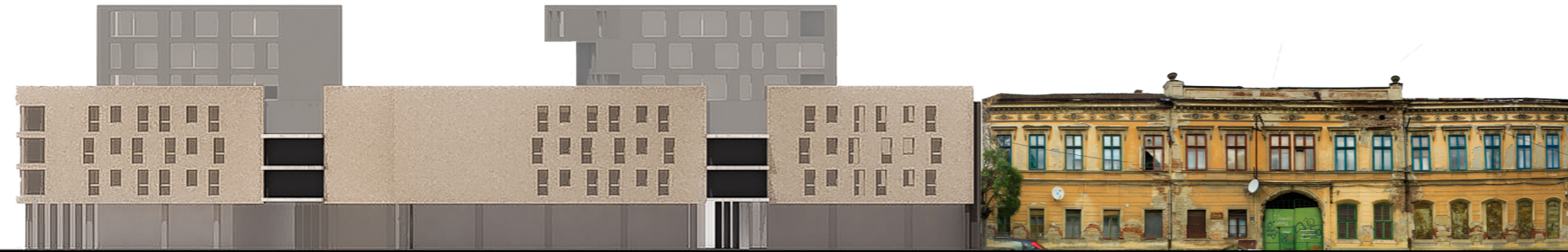
p i a t a A u r e l V l a i c u