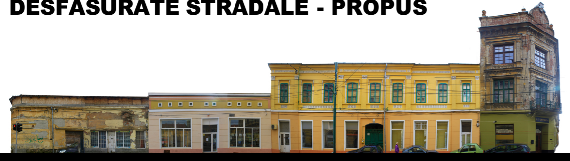
s t r a d a I o n M i h a l a c h e