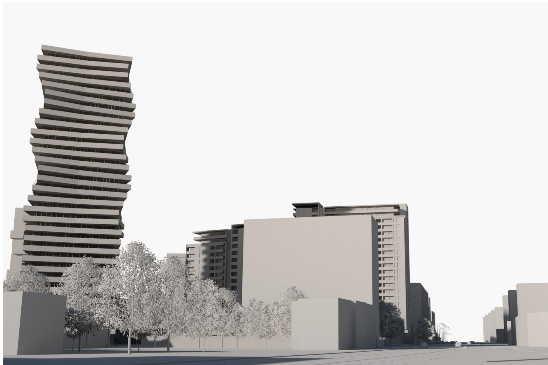
03 - VEDERE DINSPRE TAKE IONESCU