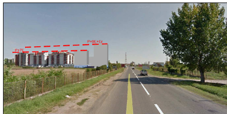
VEDERE CALEA TORONTALULUI