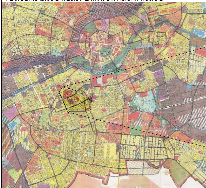
PLAN DE INCADRARE IN ZONA - EXTRAS DIN P.U.G. IN VIGOARE