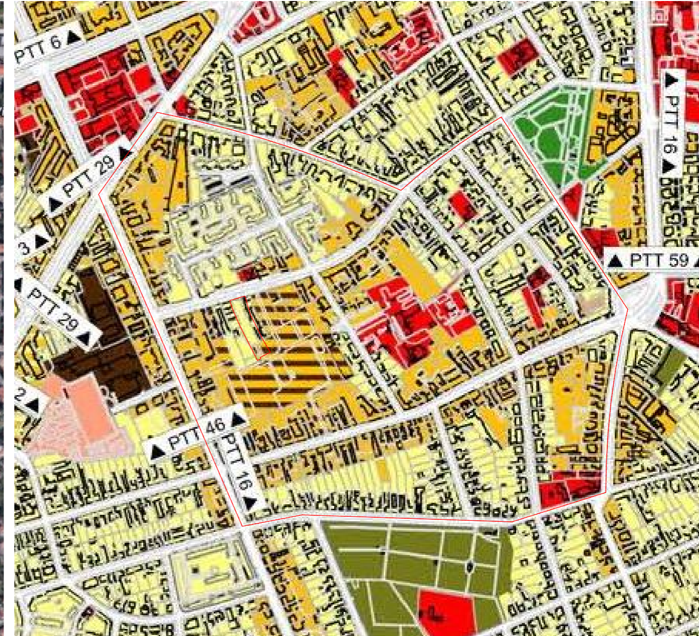
PLAN DE INCADRARE - EXTRAS DIN PUG IN CURS DE APROBARE ETAPA3 - REVIZIA 3