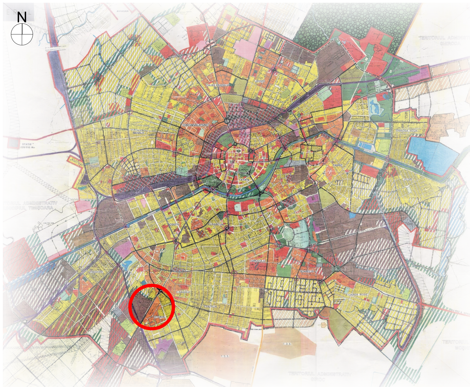
ÎNCADRARE ÎN P.U.G. 2002