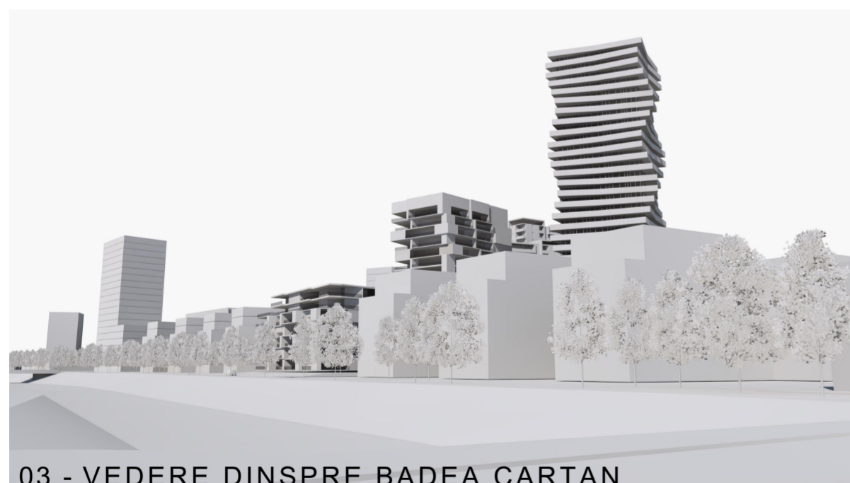
03 - VEDERE DINSPRE BADEA CARTAN