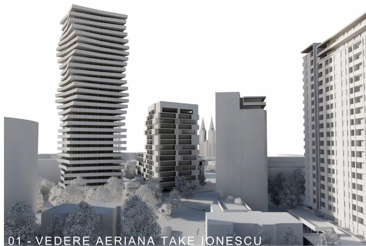
01 - VEDERE AERIANA TAKE IONESCU