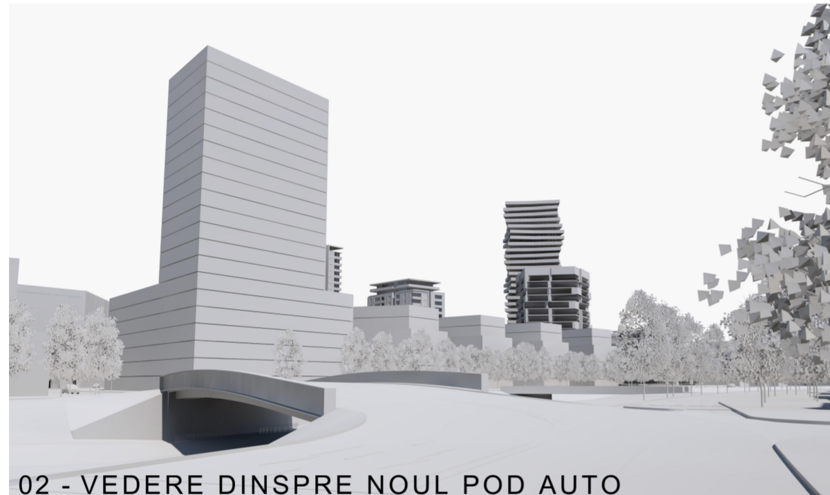
02 - VEDERE DINSPRE NOUL POD AUTO