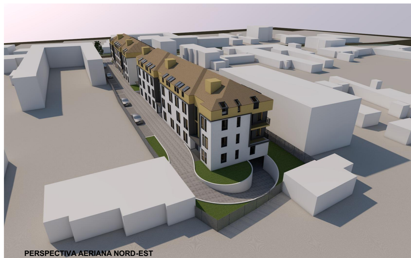
PERSPECTIVA AERIANA NORD-EST