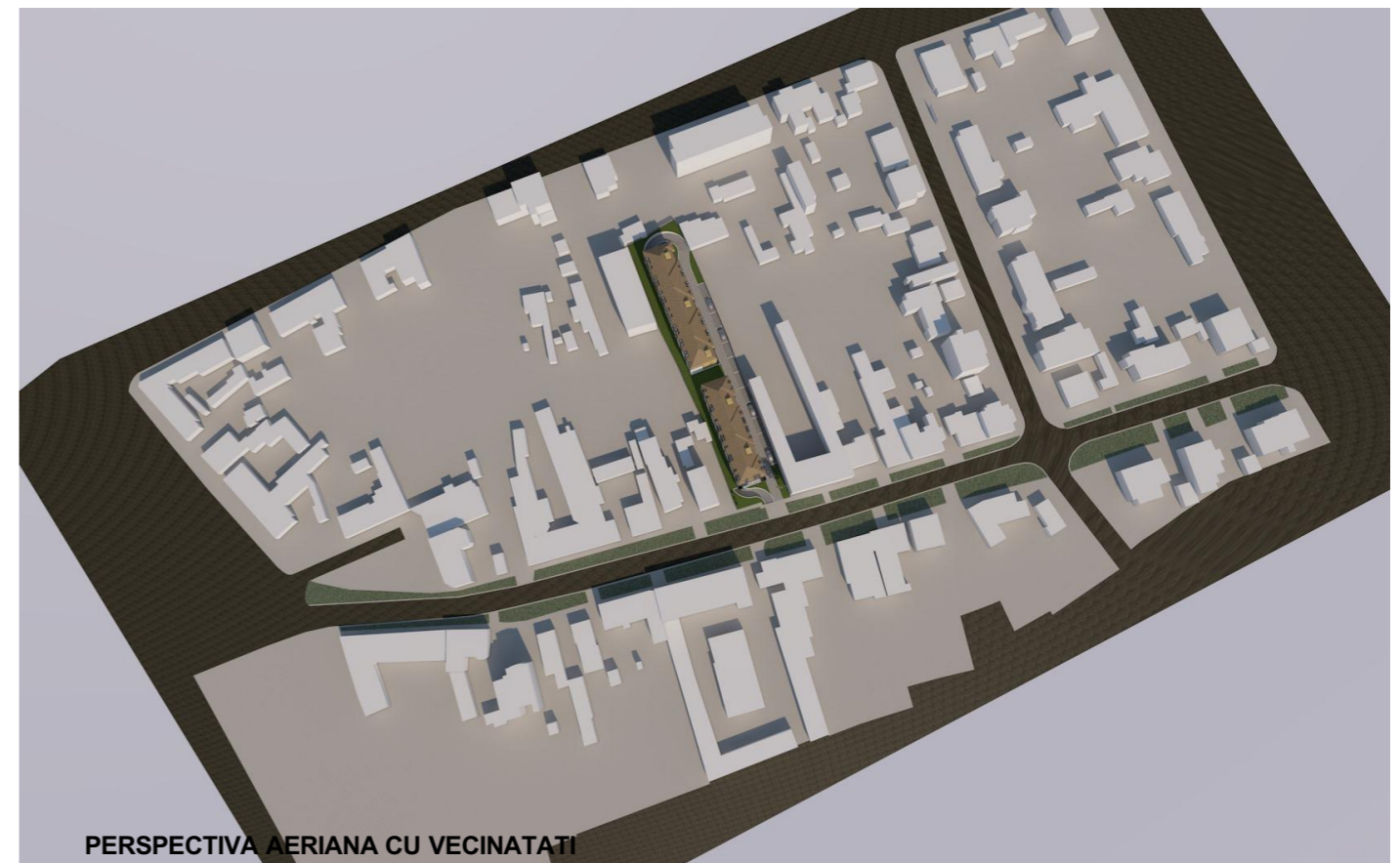
PERSPECTIVA AERIANA CU VECINATATI