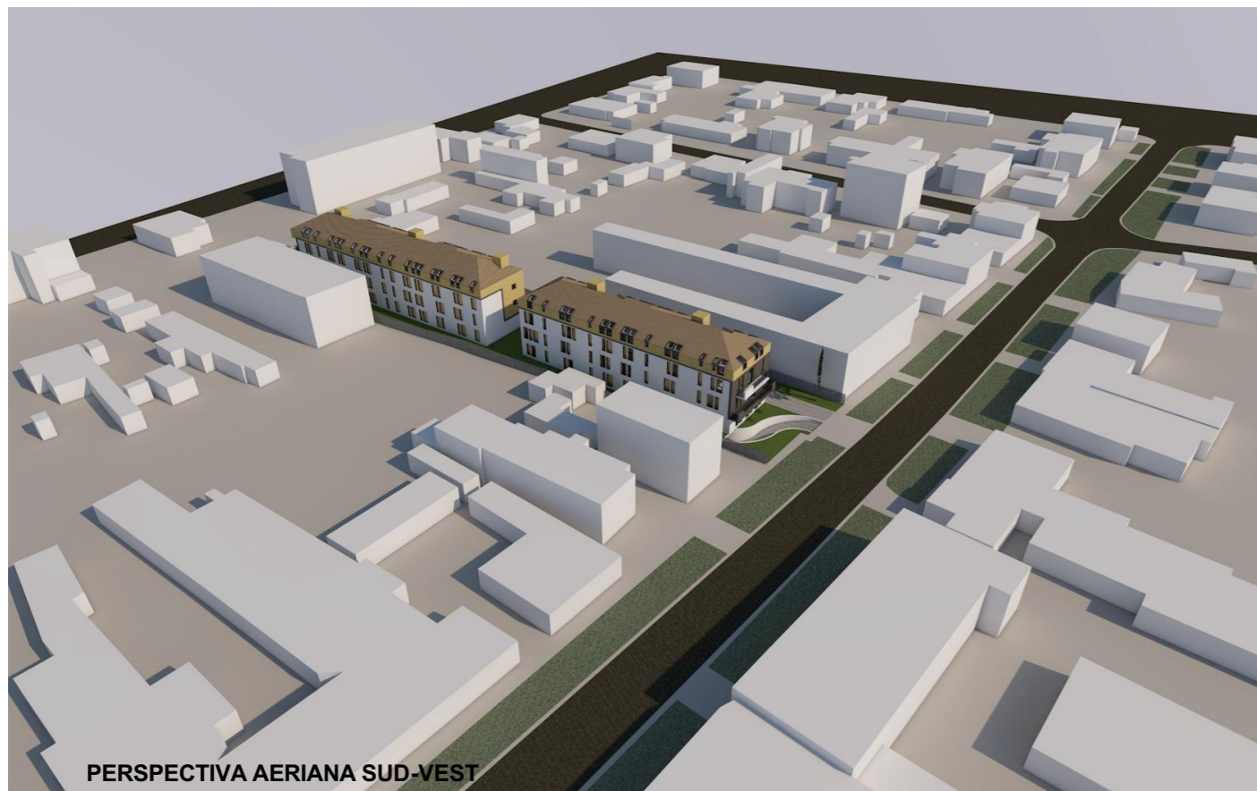
PERSPECTIVA AERIANA SUD-VEST