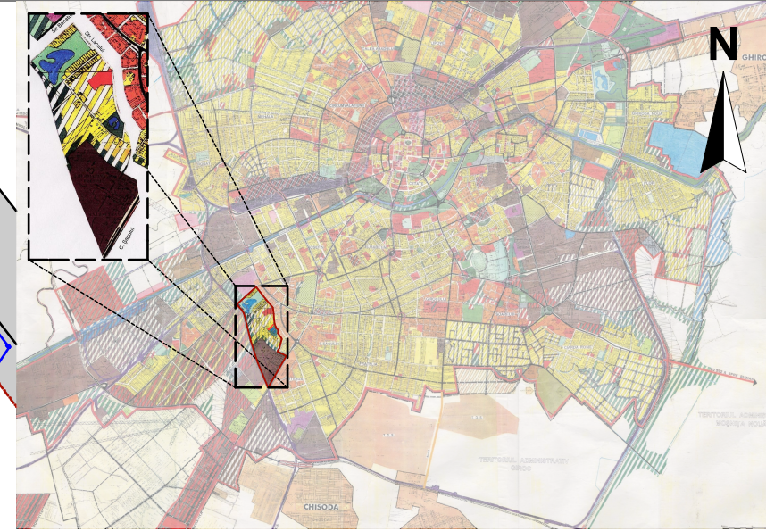
EXTRAS DIN P.U.G. IN VIGOARE - UTR 52