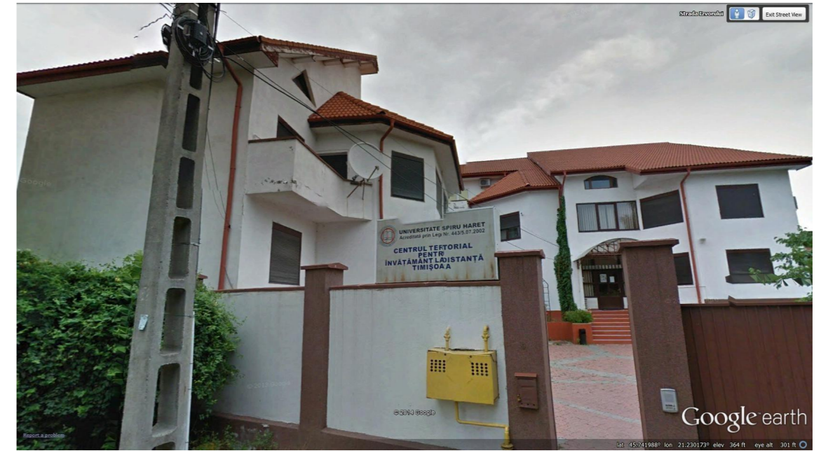
CLADIRE DE PE STR IZVORULUI CU CALCAN DE 13M SPRE PARCELA STUDIATA