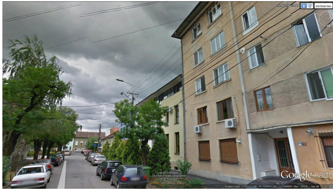
BLOC DE LOCUINTE P+4 LA PARC, PE STRADA CARE ARE CAPAT DE PERSPECTIVA OGLINDA SA