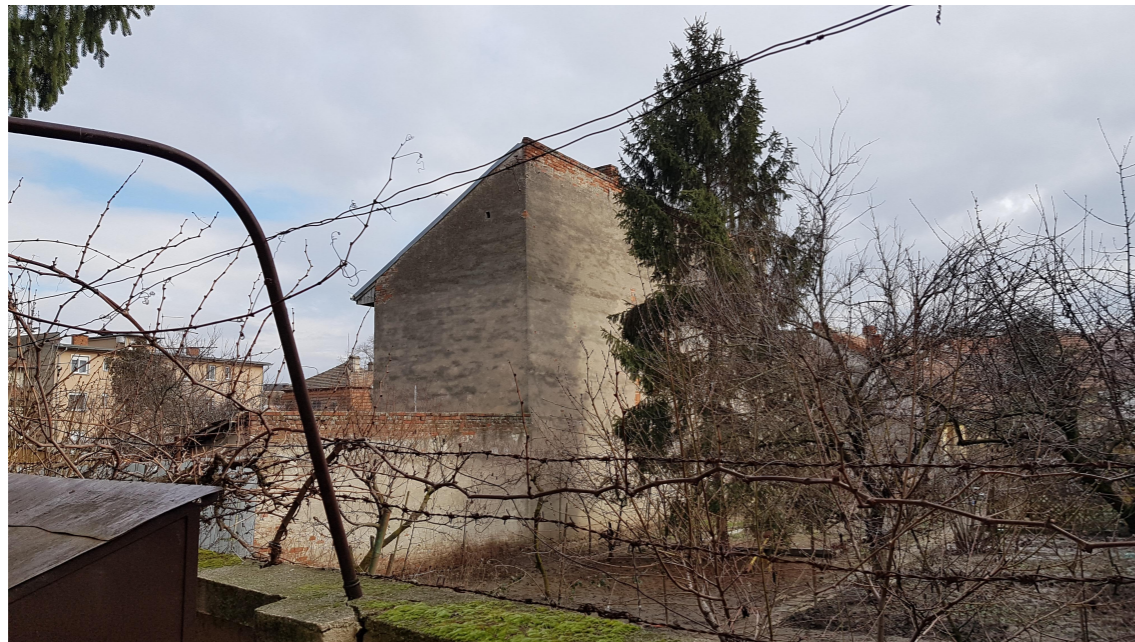
CLADIRE DE PE STR 1 DECEMBRIE CU CALCAN DE 12M SPRE PARCELA VECINA CU PARCELA STUDIATA