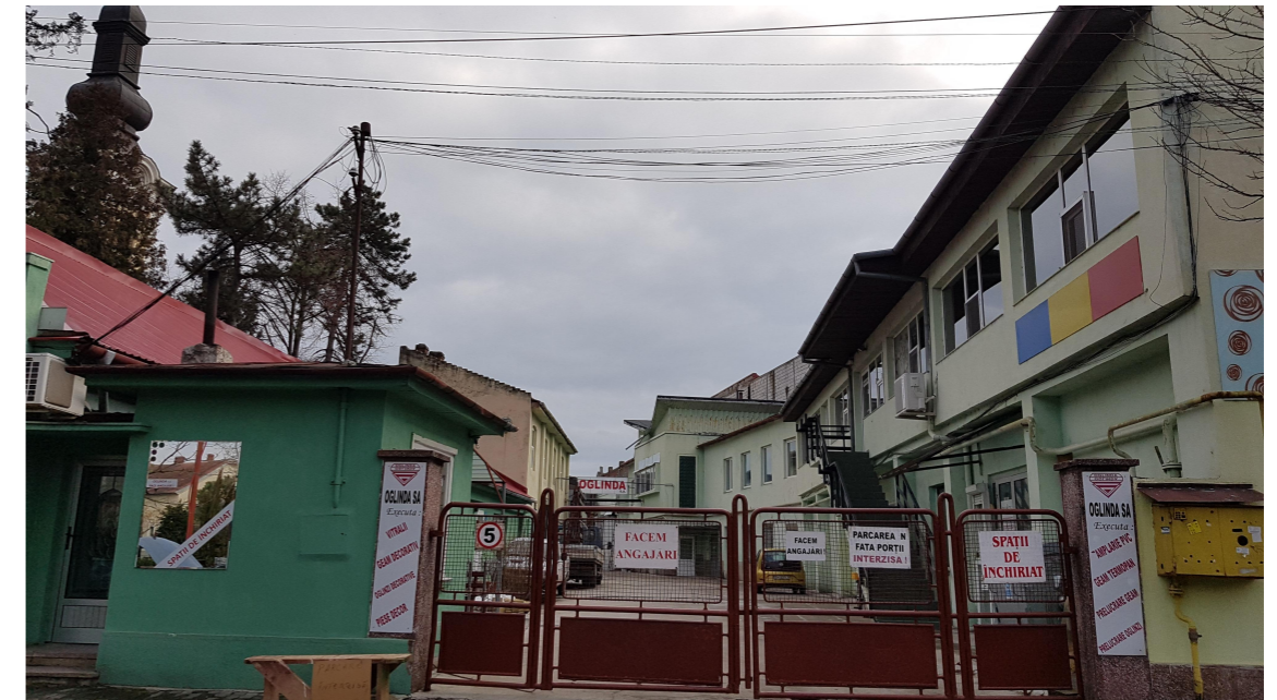
CLADIREA OGLINDA SA EXISTENT

© ACEST PROIECT ESTE PROPRIETATE INTELECTUALA A PUICA RADU BIROU INDIVIDUAL DE ARHITECTURA ORICE REPRODUCERE FARA ACORDUL PROPRIETARULUI DE DREPT ESTE ILEGALA SI SE PEDEPSESTE CONFORM LEGII