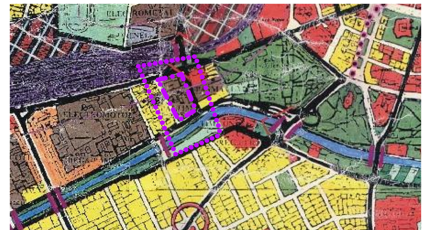
ÎNCADRARE ȘI ZONIFICARE CONFORM PUG 1998 UTR 3 - ZONĂ ACTIVITĂȚI INDUSTRIALE