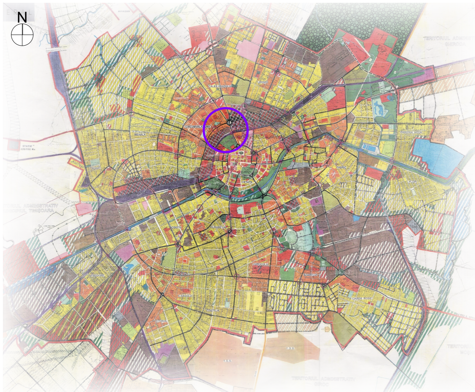
ÎNCADRARE ÎN P.U.G. 2002