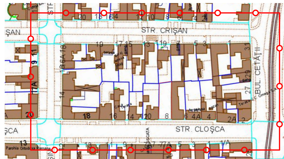
PLAN DE SITUAȚIE- ZONA STUDIATĂ