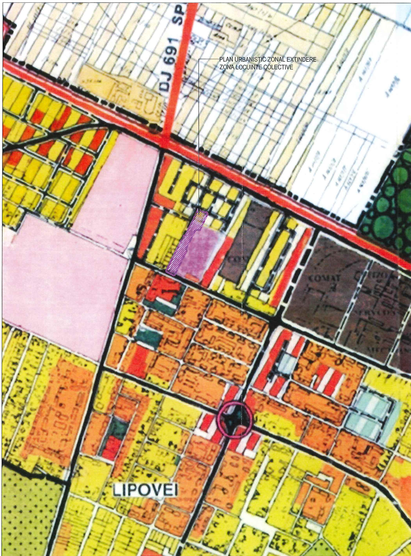
PLAN URBANISTIC ZONAL EXTINDERE ZONA LOCUINTE COLECTIVE