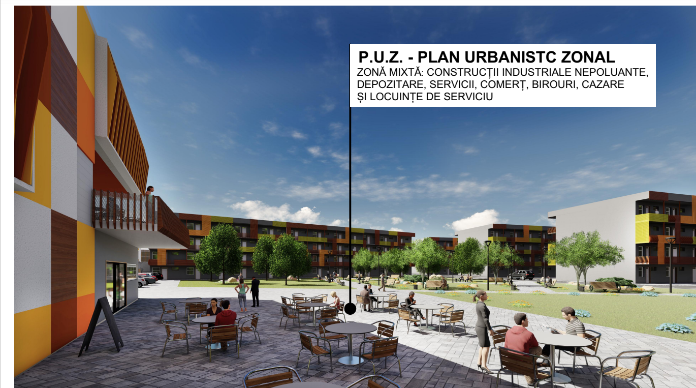
SIMULARE POSIBILITĂȚII DE MOBILARE URBANĂ