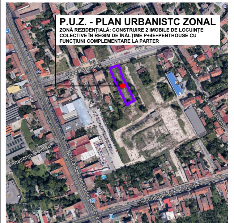
ÎNCADRARE ÎN ZONĂ - extras din hărțile digitale Google Earth - scara 1:5000

ZONĂ REZIDENȚIALĂ: CONSTRUIRE 2 IMOBILE DE LOCUINȚE COLECTIVE ÎN REGIM DE ÎNĂLȚIME P+4E+PENTHOUSE CU FUNCȚIUNI COMPLEMENTARE LA PARTER