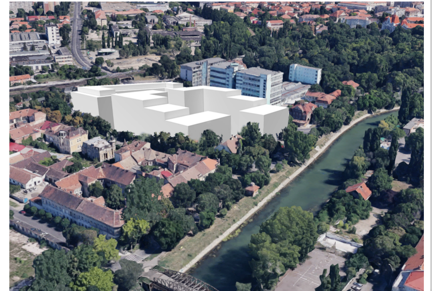
SCHIȚĂ VOLUMETRIE PROPUȘĂ