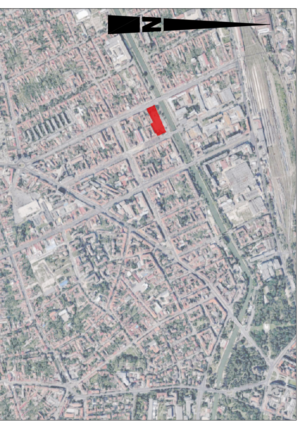
PLAN INCADRARE SCARA GRAFICA