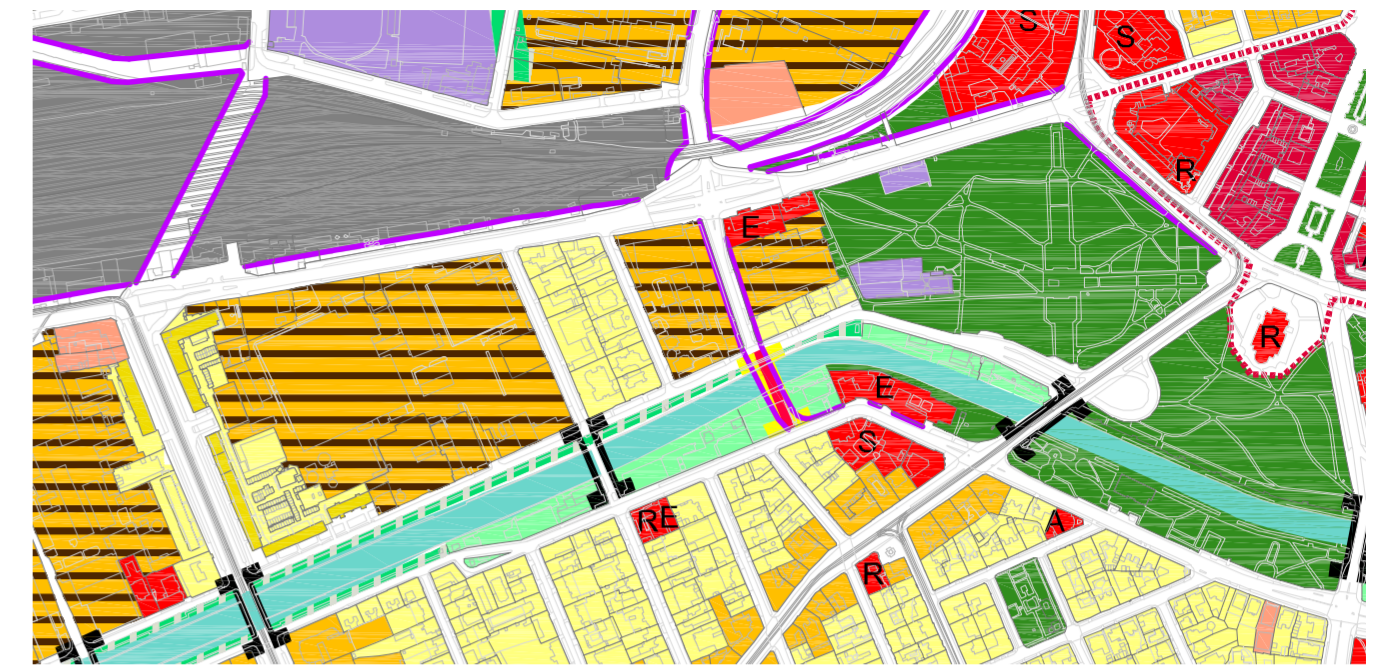
ZONIFICARE CF. PUG NOU